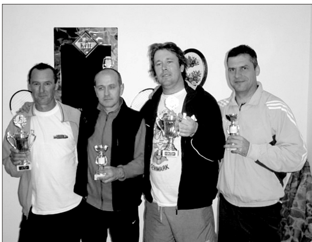
○ VÍ AZI turnaja štvorhier, aj so získanými trofejami..