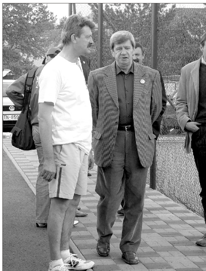
○ Tenisové kurty v Lutile. Starosta obce v družnom rozhovore s ministrom zahraničných vecí SR Eduardom Kukanom.